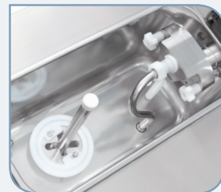
• Деталь бака с перемешивателем: опция EMU.