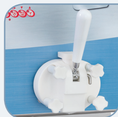
• Рукоятка крана подачи продукта.